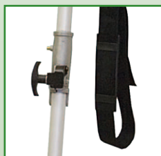
Canne démontable sans outils. Facilité de transport