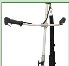
Guidon large avec poi- gnées ergonomiques