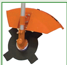
Coupe par disque acier 4 dents - Ø 255 mm